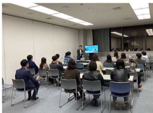
活動前、パートナー会社が実施しているサステナビリティ活動のレクチャーを受ける

年数回、始業前にごみゼロ運動を実施しております。 今回、営業戦略推進本部が【AIをはじめとするIT技術が革新していく中で、人の手でしかできないことで社会貢献を】と銘打ち、初の試み 夜間ごみゼロ運動 をパートナー会社の方と共に実施しました。