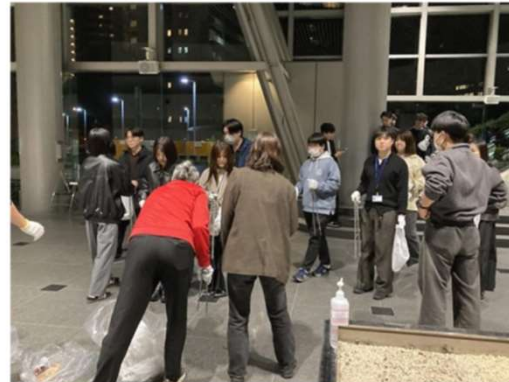
会社に戻り、ゴミの分別もきちんと行いました