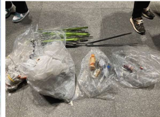
短い時間での活動でしたがごみを集める事が出来ました