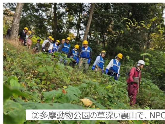
②多摩動物公園の草深い裏山で、NPOの方と共に草刈りを実施。必要な樹木を守る作業