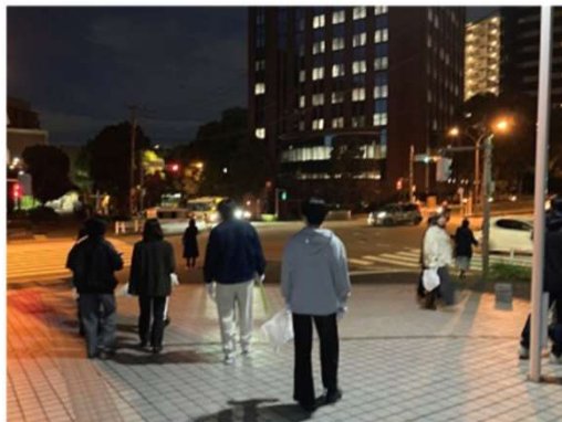
少し肌寒い中、ごみ袋とトングを手に夜の町へ出発して行きました