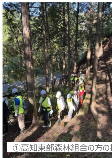
①高知東部森林組合の方の指導の下、急斜面で伐採作業